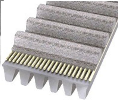
Рисунок 2 - Зубчасто-поліклиновий пас.